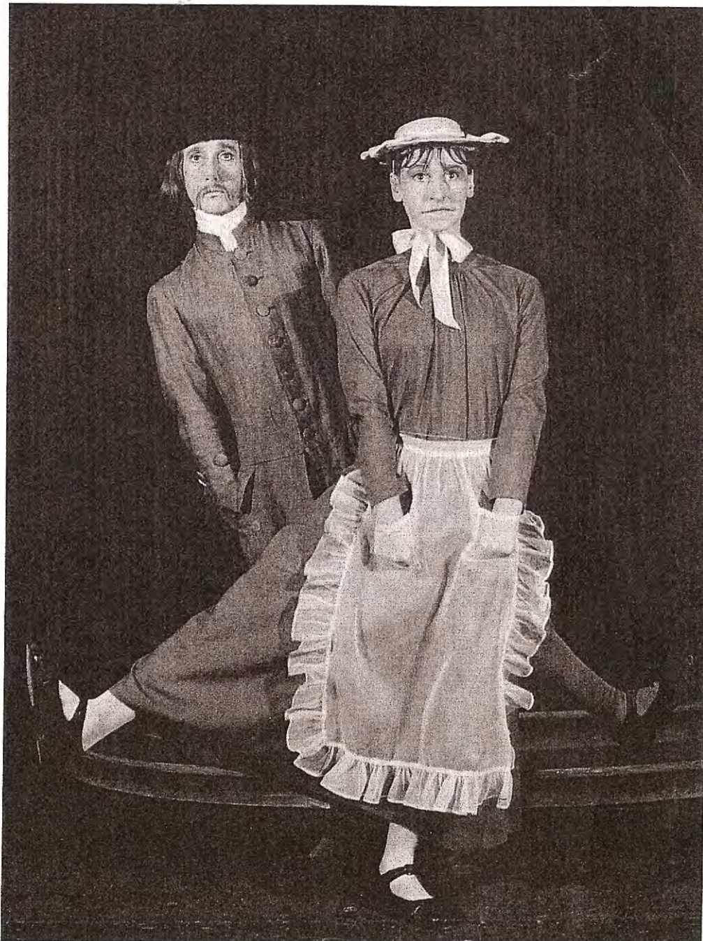
Her ser ein kvækarparet i ei nyare dansk oppsetting av verdas eldste ballet Amor og balletmeistarens luner.