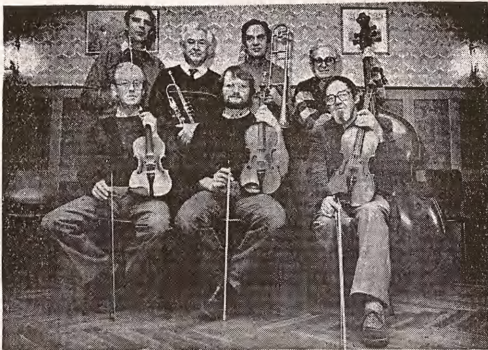
„ 1894- orkesteret ” , 1988