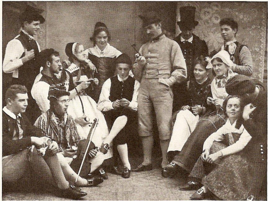
De, der begyndte . 1900—1901

Folkedanserforeninger optræder gerne i gamle egnsdragter ("folkedragter") som et festligt indslag ved forskellige arrangementer. Når vi er turister i et fremmed land, er det også oplevelse at se deres