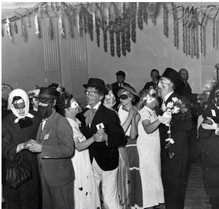
Karneval i "Gamle Danses Værn", Kolding, 1956.

Da ”gammeldaws dans” i første halvdel af 1900-tallet mødte konkurrence fra den amerikanske musik, dannedes der i mellemkrigstiden overalt i landet masser af ”gammeldans-foreninger”. Målet var, at den musik og dans, som man havde kendt og brugt fra barnsben af skulle leve videre.