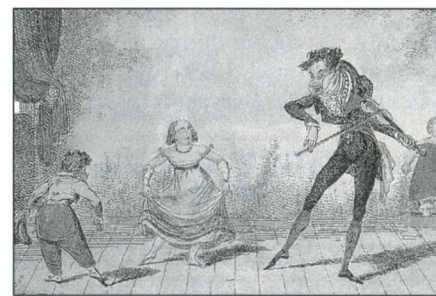
Danselæreren underviser et barnepar i menuet.