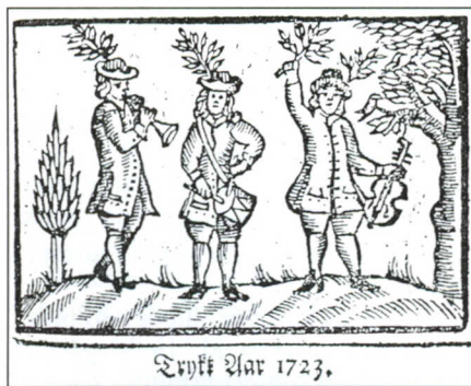
Festlige musikanter i 1723.