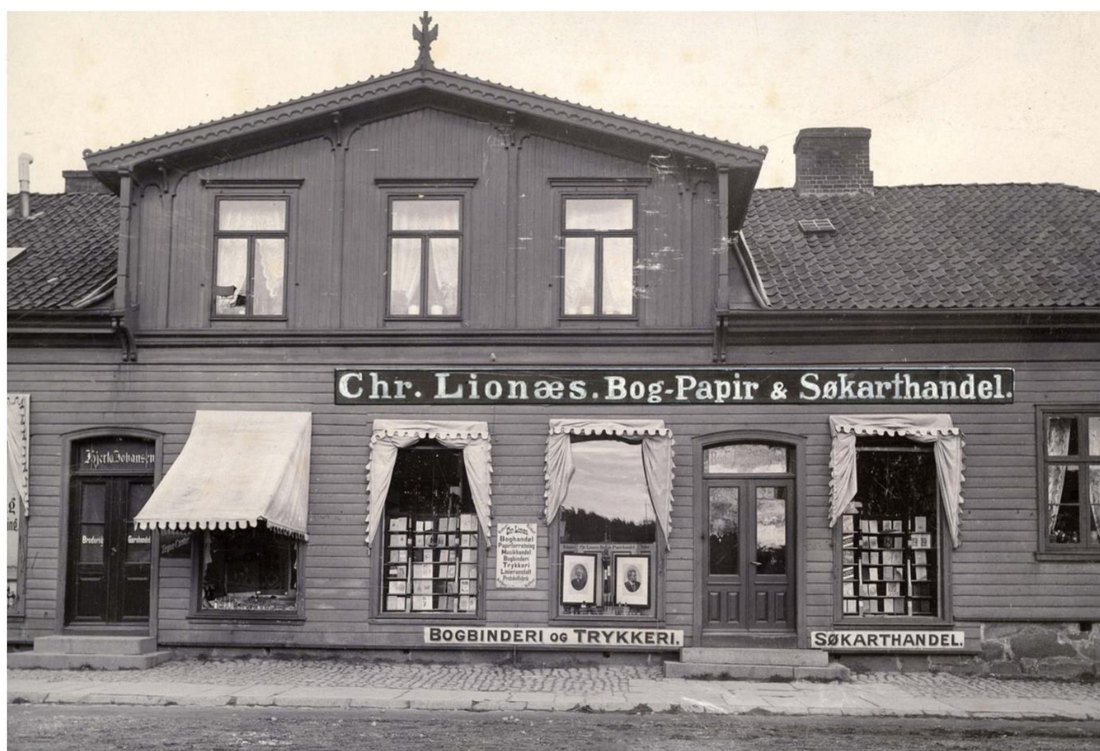
Lionæs's boghandel i Frederikstad 1896.

optrykt og udvidet 1899, hvor Sandbeck var derovre. Fire af de amerikanske danse, som Sandbeck har med i sin undervisning, findes også i Clendenen's bog fra 1899.