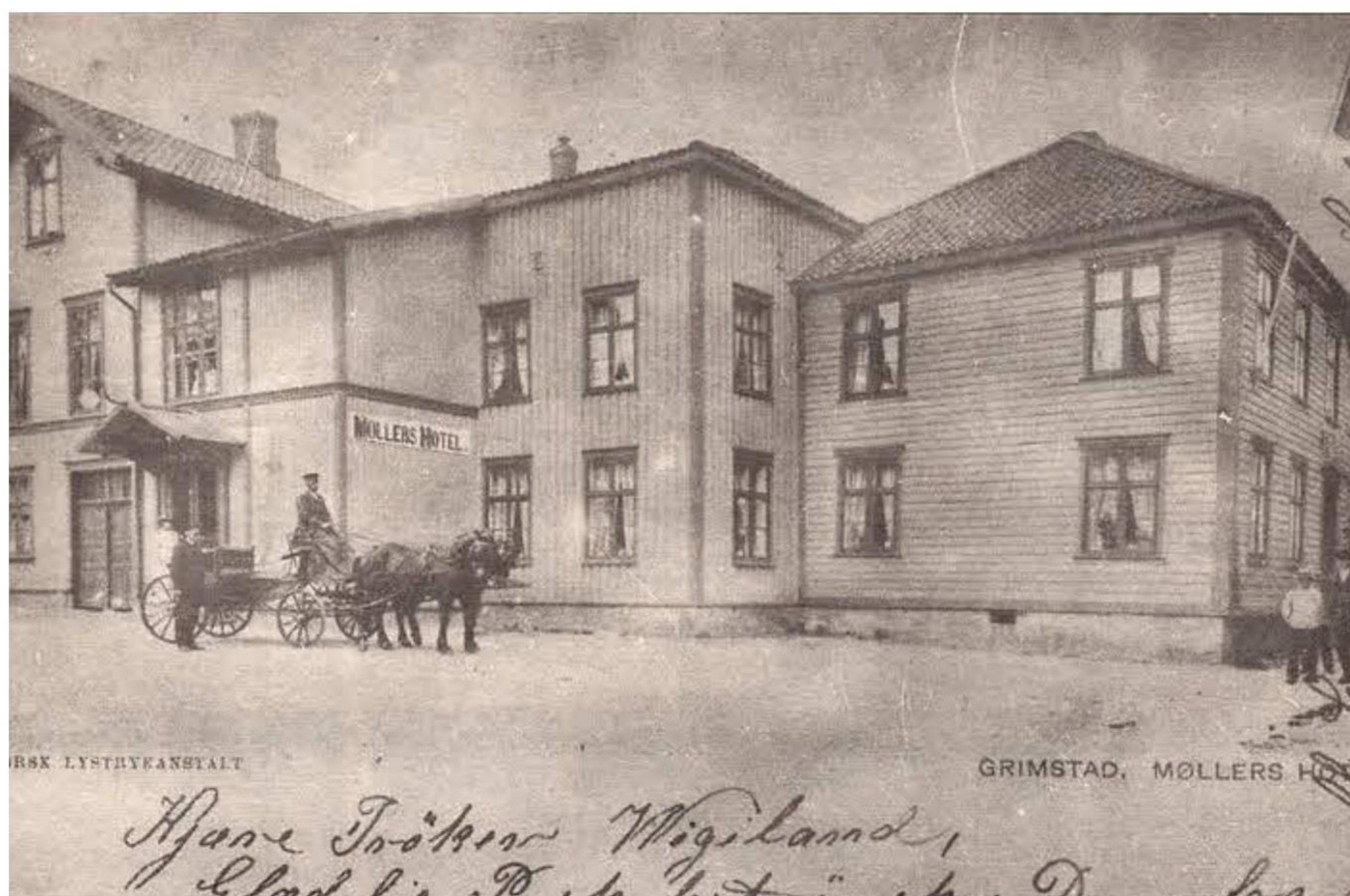
Møllers hotel i Grimstad.