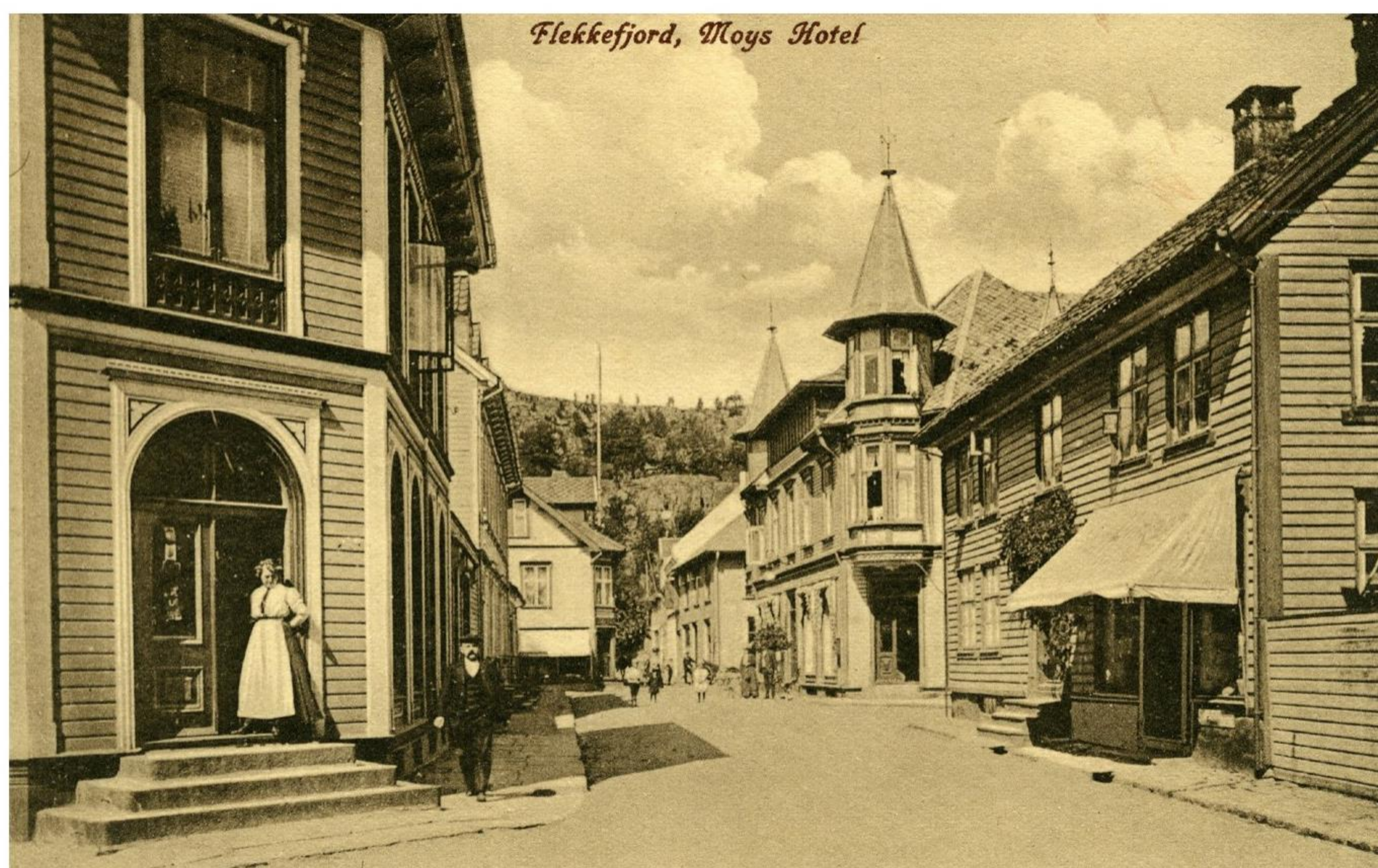
Moys hotel i Flekkefjord.