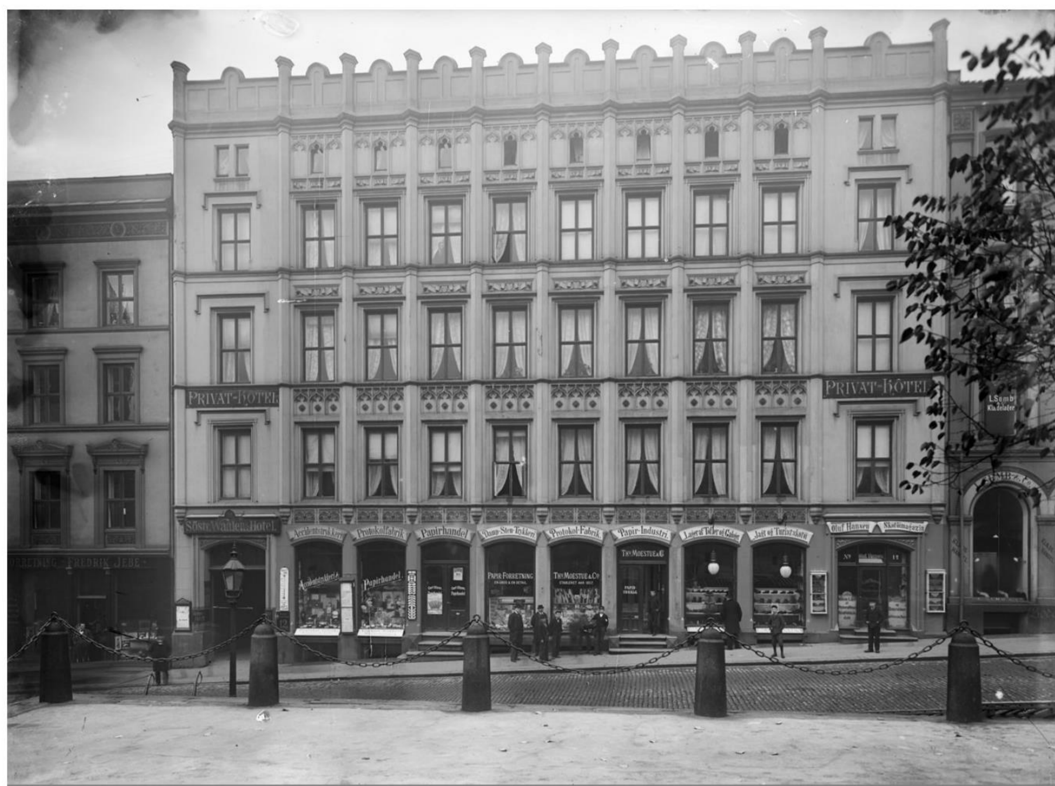
Søstrenes Waalens Privathotel, Karl Johans Gade 12 i Kristiania.