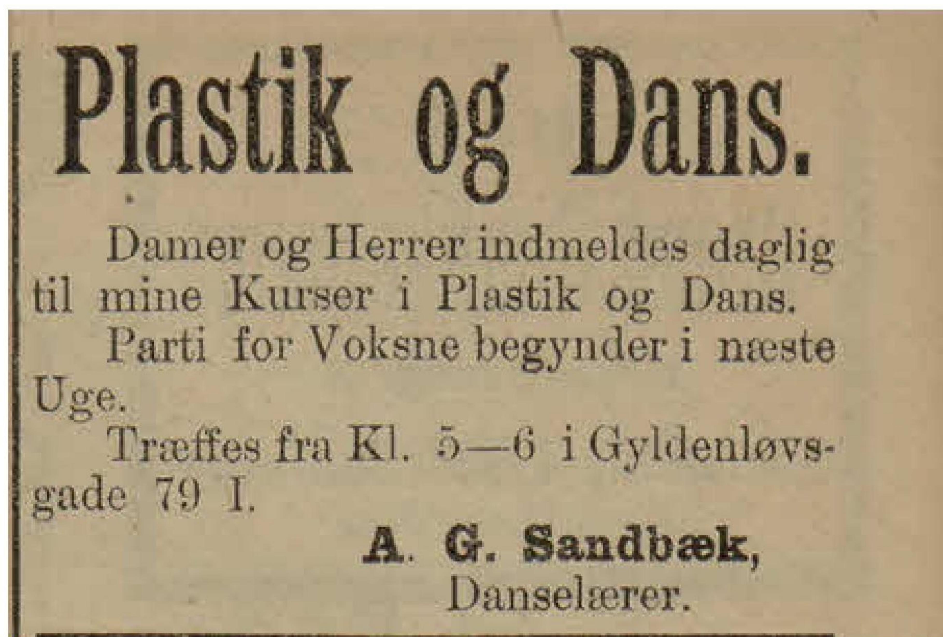
Avisen "Fædrelandsvennen" fra Kristiansand d. 4. december 1897.