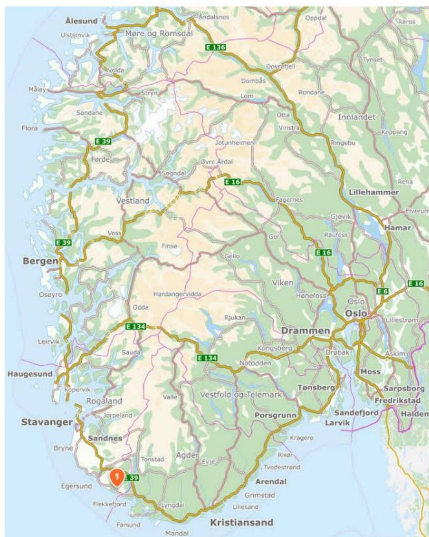
Sandbækk ved Sokndal.

Der er lidt navneforvirring vedrørende stednavnet og efternavnet Sandbeck. Stednavnet hedder i dag Sandbækk, og i datidens aviser stavede Sandbeck sit efternavn Sandbæk og senere Sandbæck, indtil det fra august 1902 blev