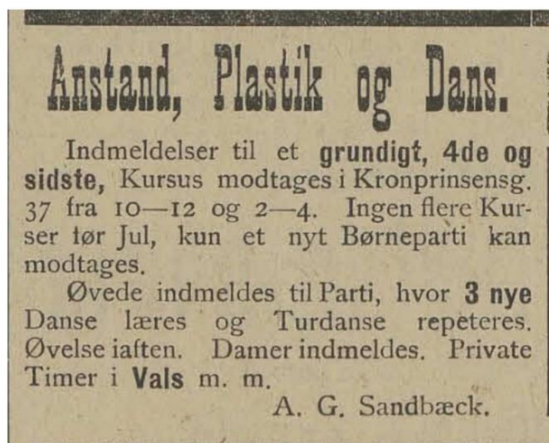
Christiansands Tidende 4. oktober 1898.