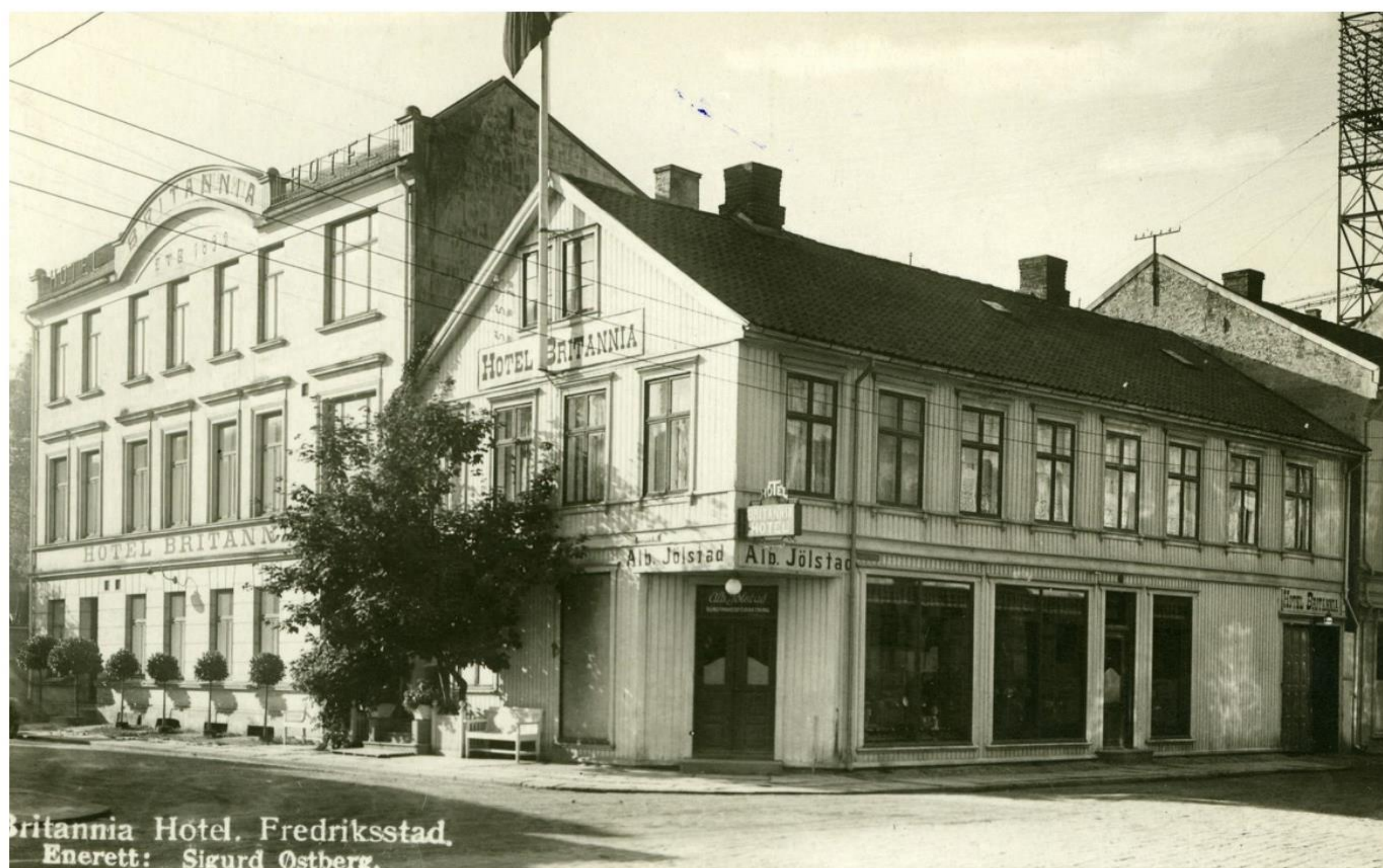
Hotel Britannia Frederiksstad, 1892.