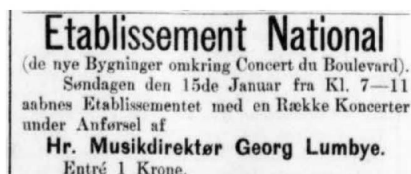
Avisen "Fædrelandet" d. 14.1.1882 om åbningen af "National".

"La Scala" var et underholdningsetablisement i København, hvor der var koncertsal, café, restaurant og dans. Det lå lige overfor Tivolis hovedindgang og åbnede i 1882 med navnet "National". Ved åbningen spillede Georg Lumbyes orkester. Den 1.1.1898 skiftede den navn til "La Scala".