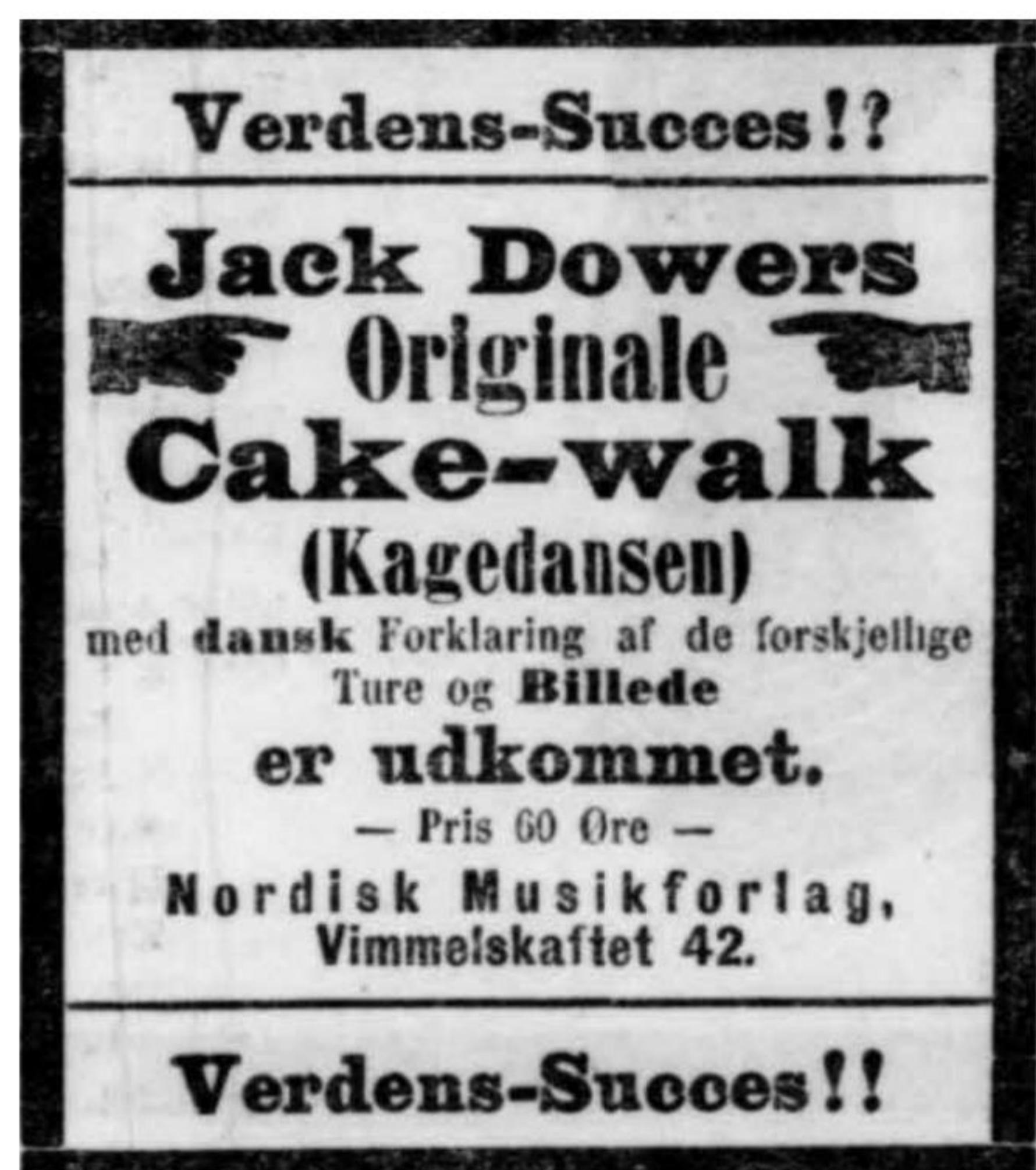
Annonce i Berlingske Tidende d. 28.2.1903.

Det ser hæsligt ud, men der har foreløbig ikke vist sig noget lægemiddel mod denne smitte. Og i grunden er det ikke så mærkeligt. Man har de senere år set ballerene fare afsted i en slags travvædeløb, der pyntedes med navnet "Pas de Quatre" og senere "Washington Post", hvor man på den mest smagløse måde stillede op herrerne bag damernes ryg, så man burde være forberedt på niggerdansen. Nogle påstår med hensyn til denne dans's oprindelse, at den skal være et forsøg på at efterligne kænguruernes måde at hoppe på, men den bekendte forfatter Theodor Wolff hævder i en korrespondance i "Berliner Tageblatt", at dette er en bagvaskelse af kænguruen.