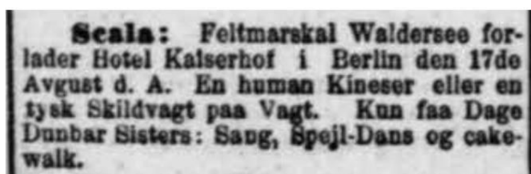
Avisen "Dannebrog" d. 25.8.1900.