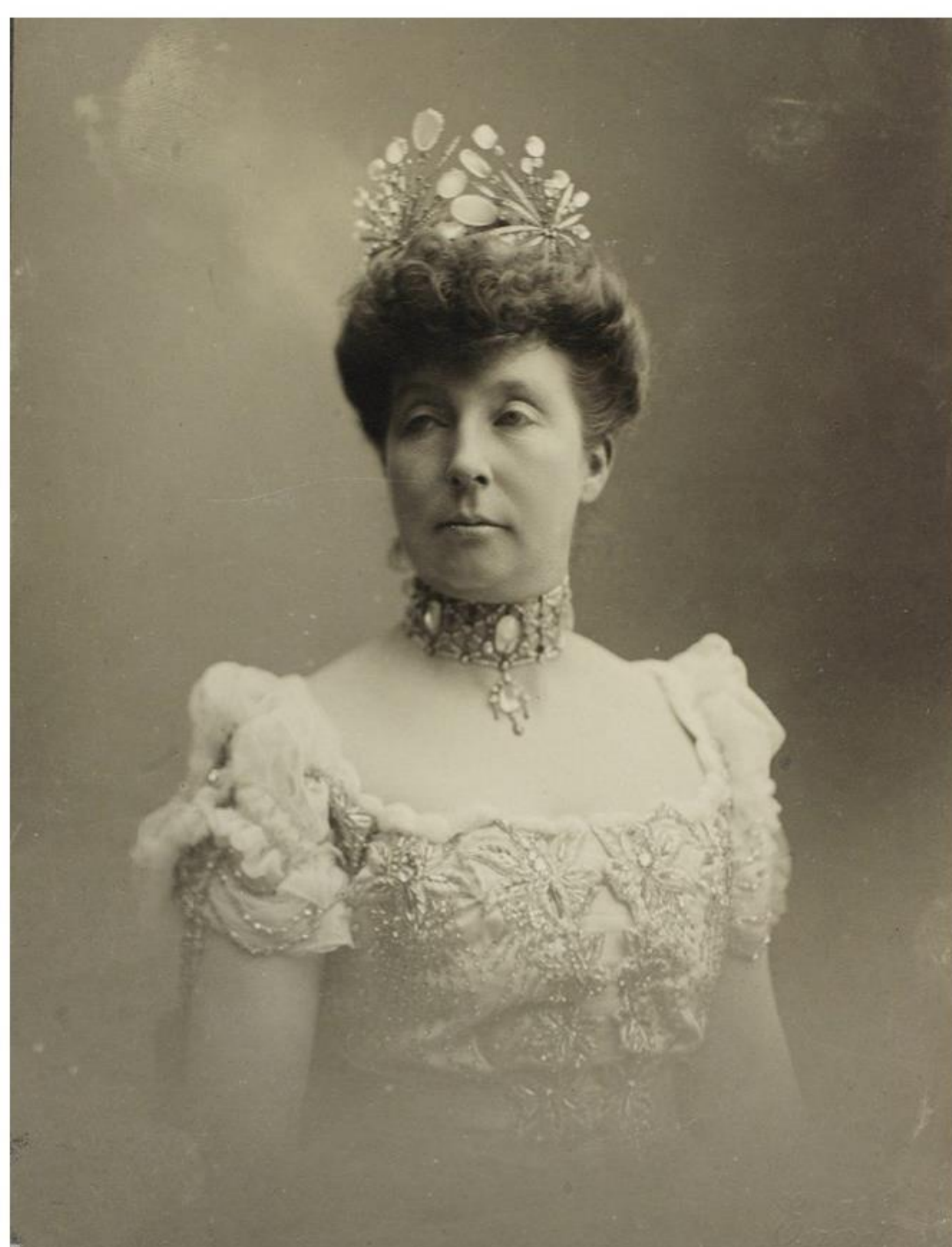
Prinsesse Marie (1865-1909).