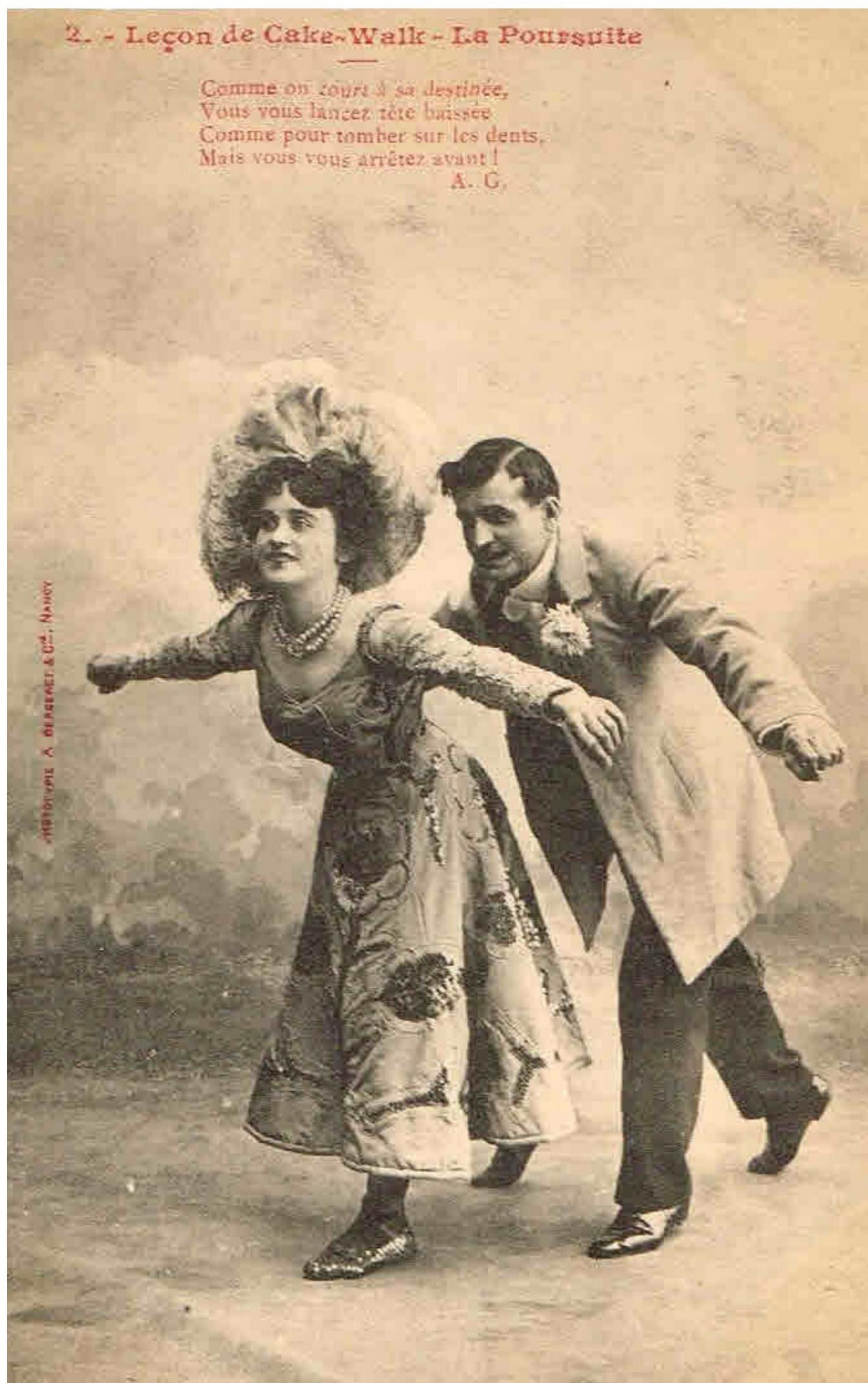
Anden lektion La Poursuite (forfølgelsen).

Statsradiofonien helt op i slutningen af 1920'erne. Det var nok fordi, at det var god musik. Selvom dansen ikke blev anvendt mere, overlevede nogle af melodierne til vore dage. En af dem er "Golliwogg's Cakewalk" fra "Children's Corner", der er en pianosuite fra 1906-08. Den er komponeret af Claude Debussy (1862-1918).