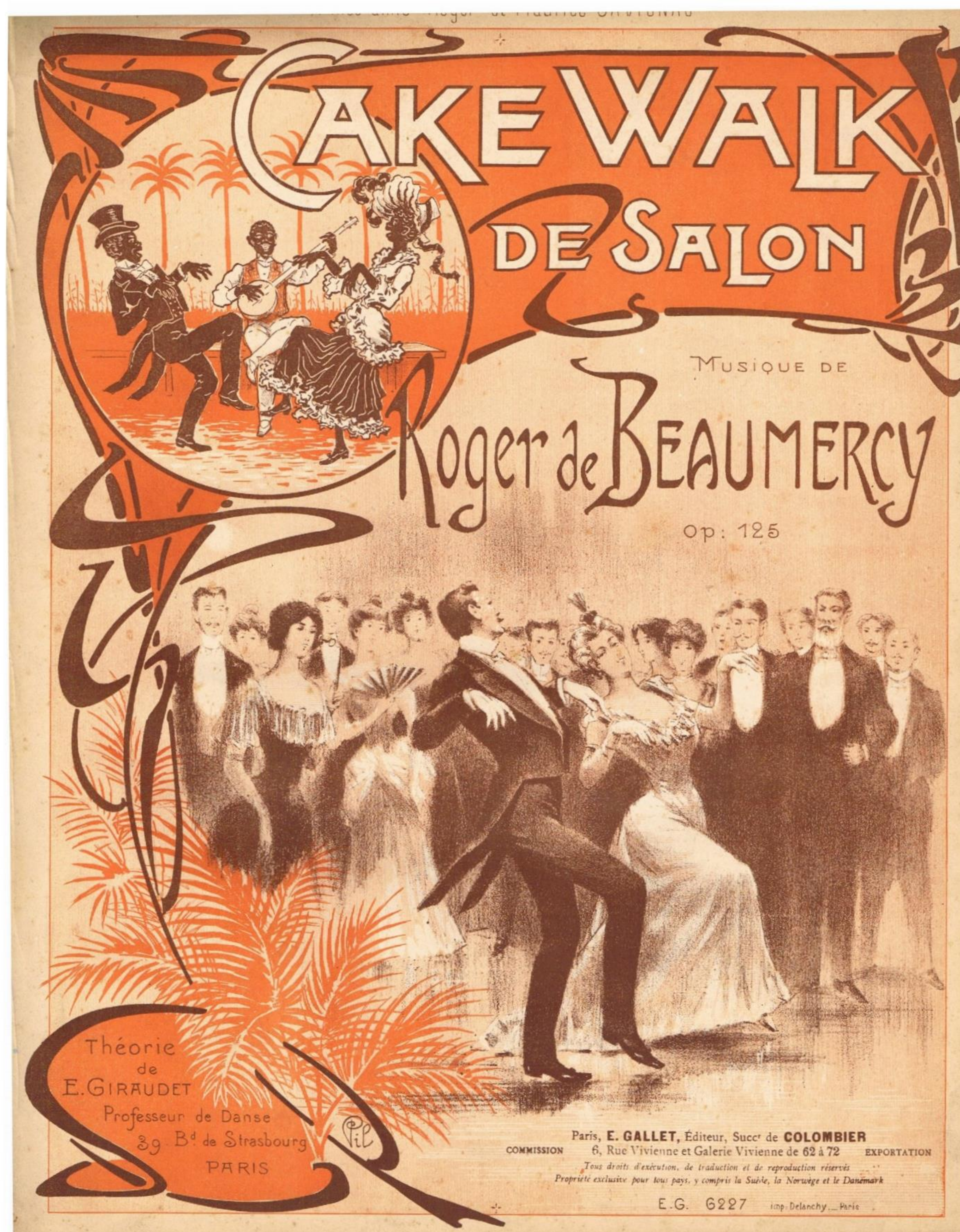
Cake-Walk de Salon, Paris 1903.

Til cake-walk var der mange melodier, hvoraf nogle stadigvæk blev spillet i