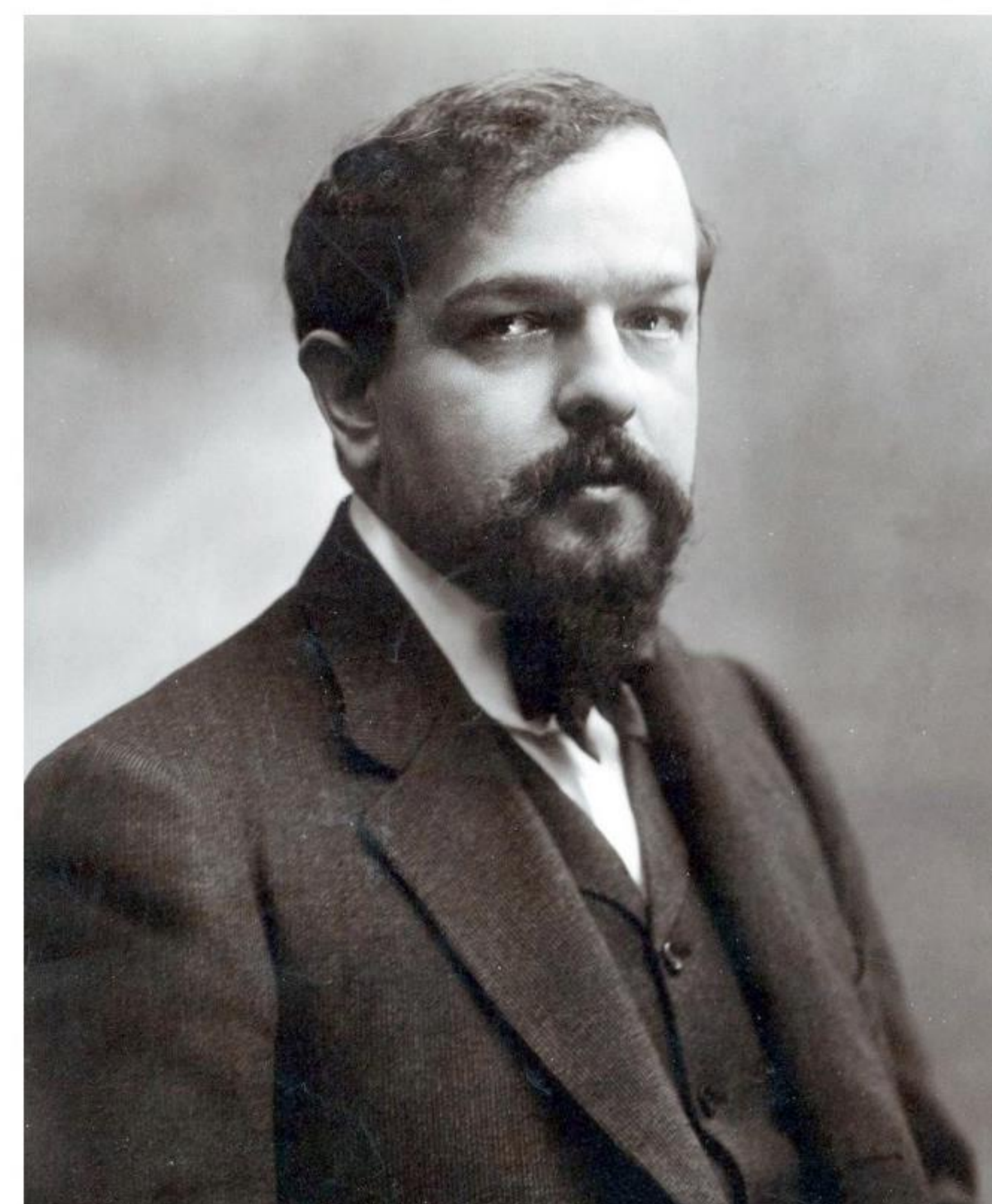
Claude Debussy (1862-1918).

https://www.youtube.com/watch?v=XMrdhgWR9Zk