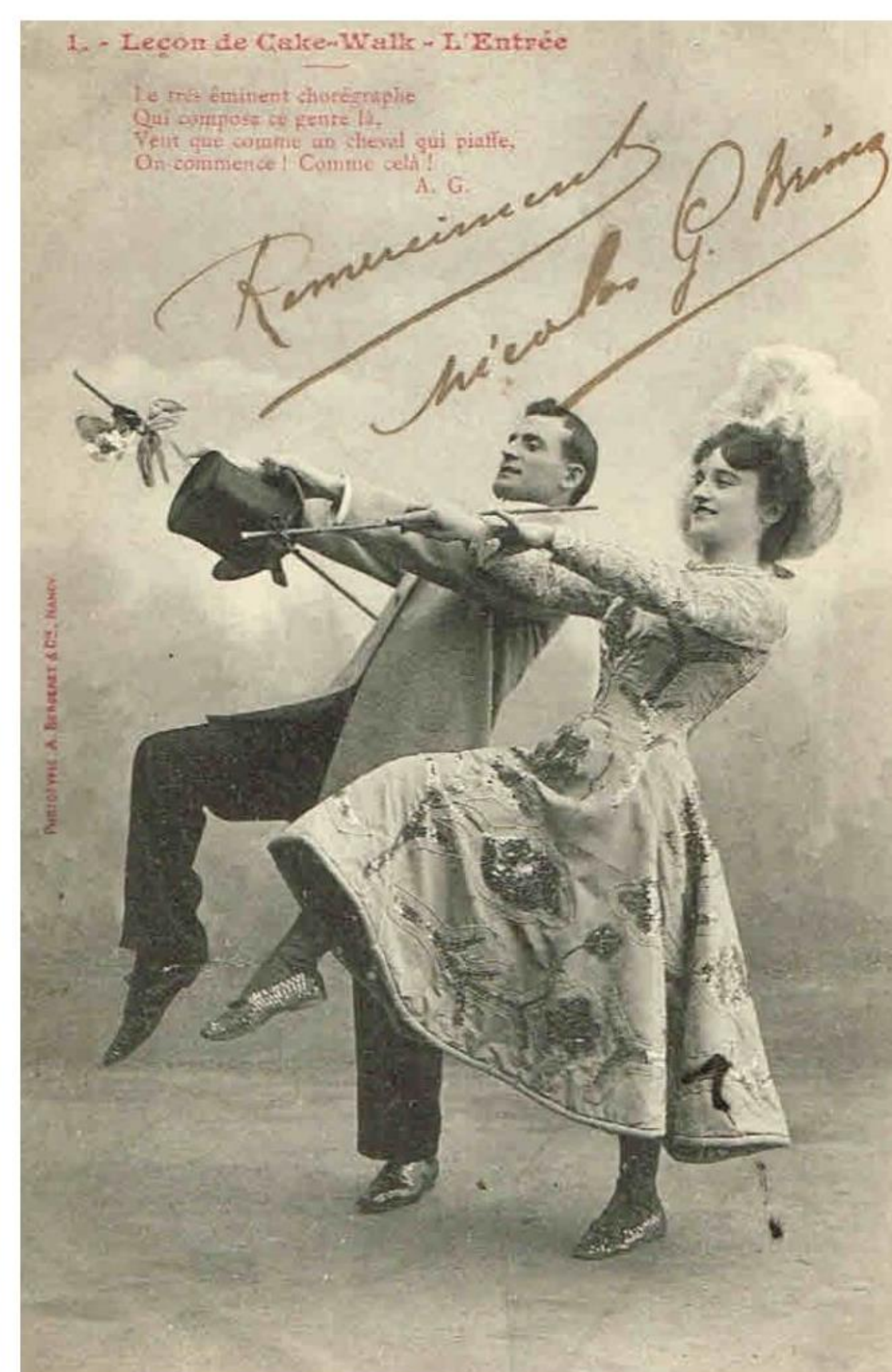
Første lektion L'Entrée (indledning).

Dansen var så populær i Frankrig, at der kom en hel serie med postkort, med de enkelte figurer i dansen. Her er de 2 første figurer. Det ene afsendt 4. november 1903 fra Paris.