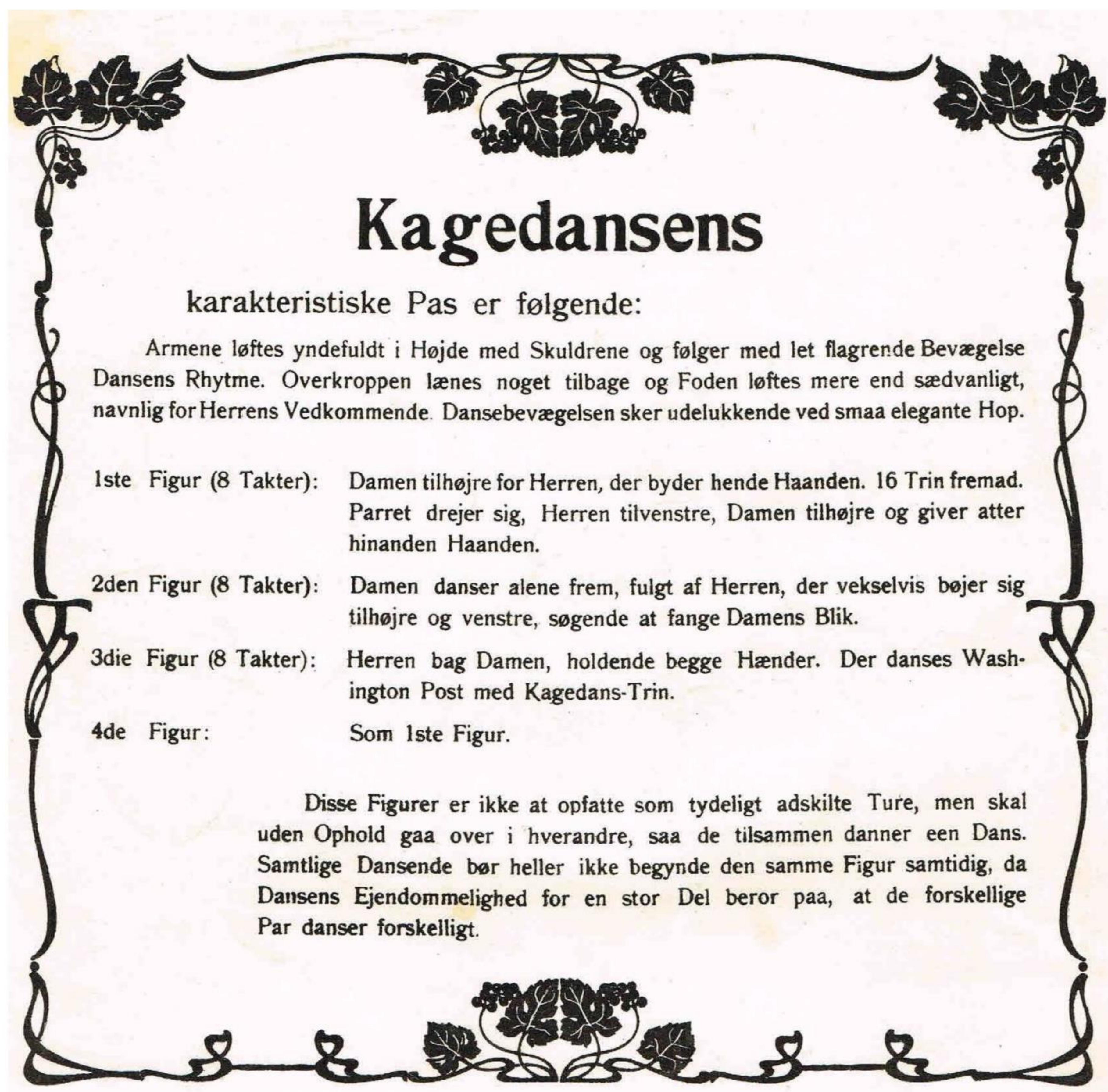
Kagedansen – dansebeskrivelse 1903.

Skulle dansen komme til os? Vi gyser ved tanken og frygter for, at Prinsesse Alexandrines Kvadrille ikke vil være i stand til at tage kampen op mod den importerede niggerdans".