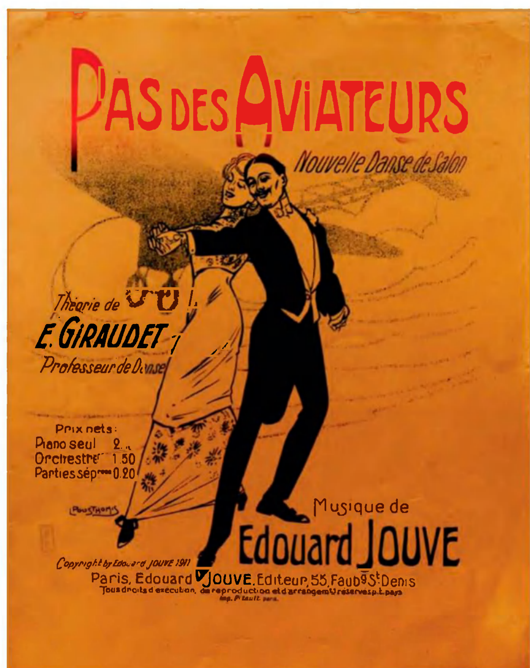
Forside af "Pas des Aviateurs" 1911