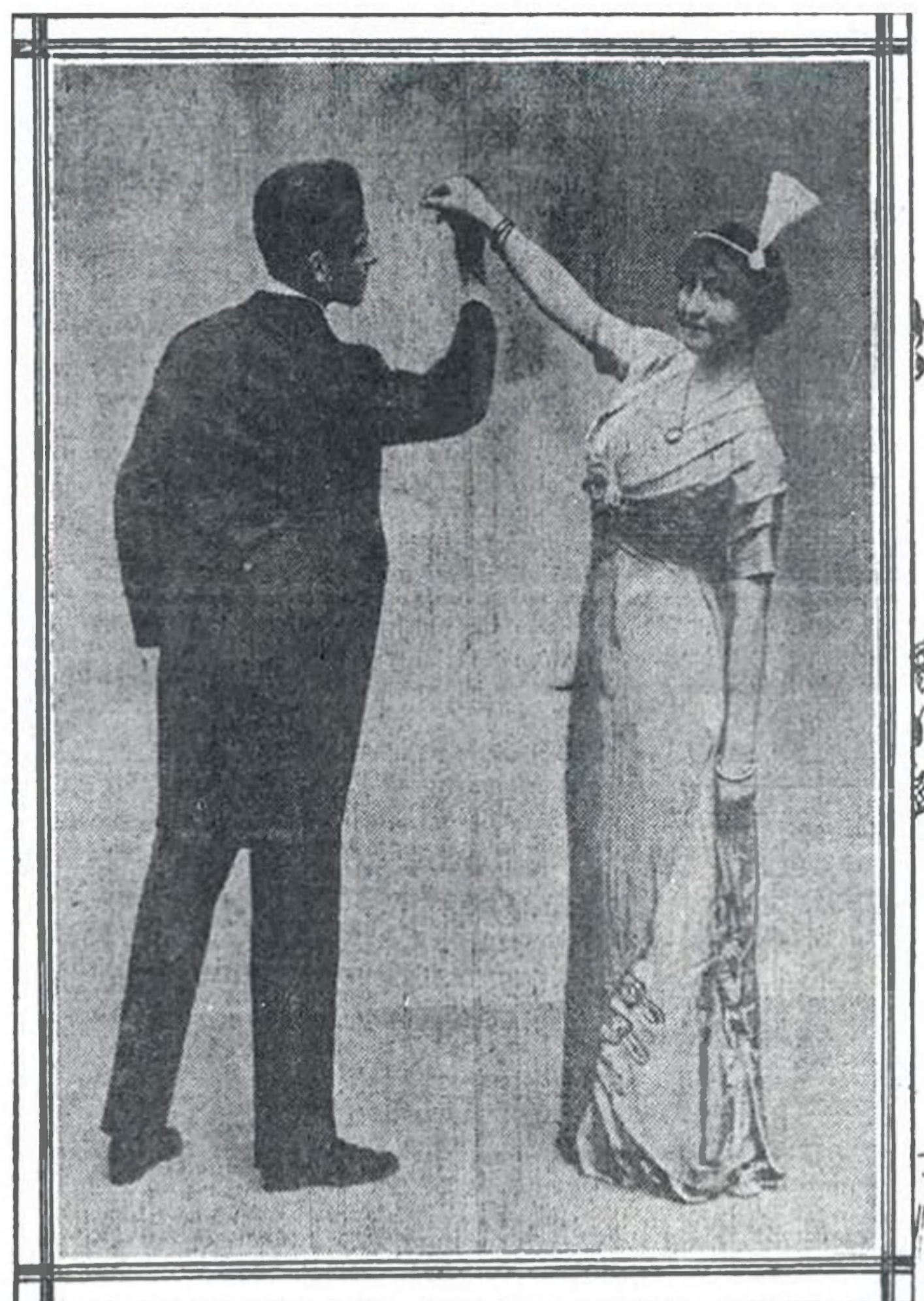
Second Figure.—The Partners Stand Facing Each Other