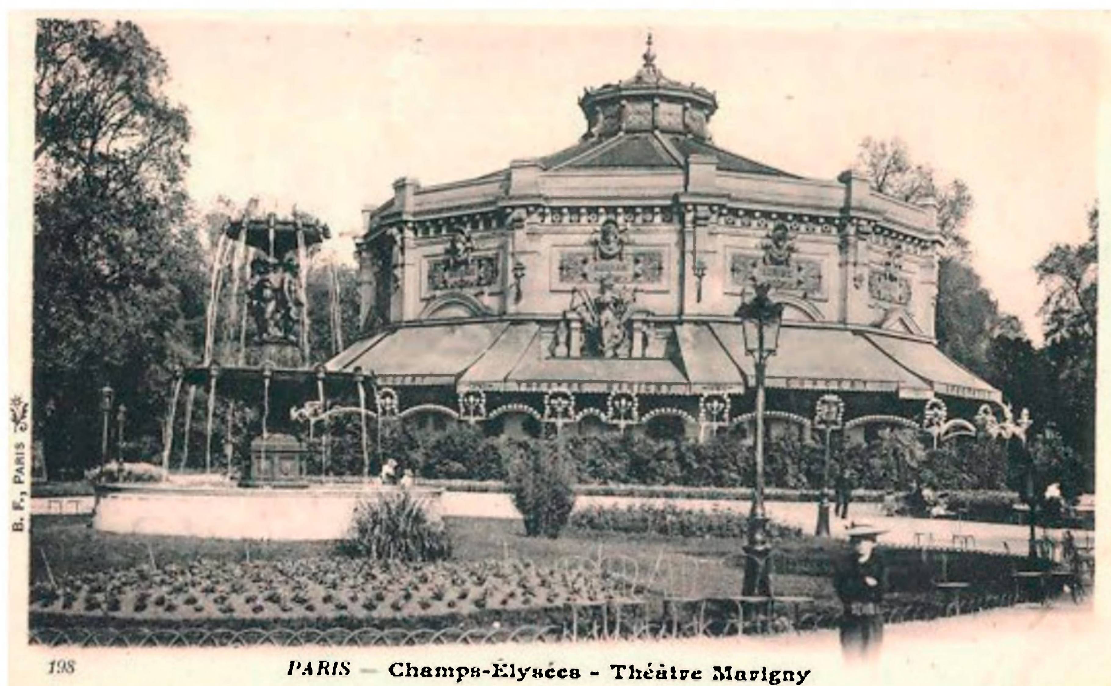
Théâtre Marigny i Paris