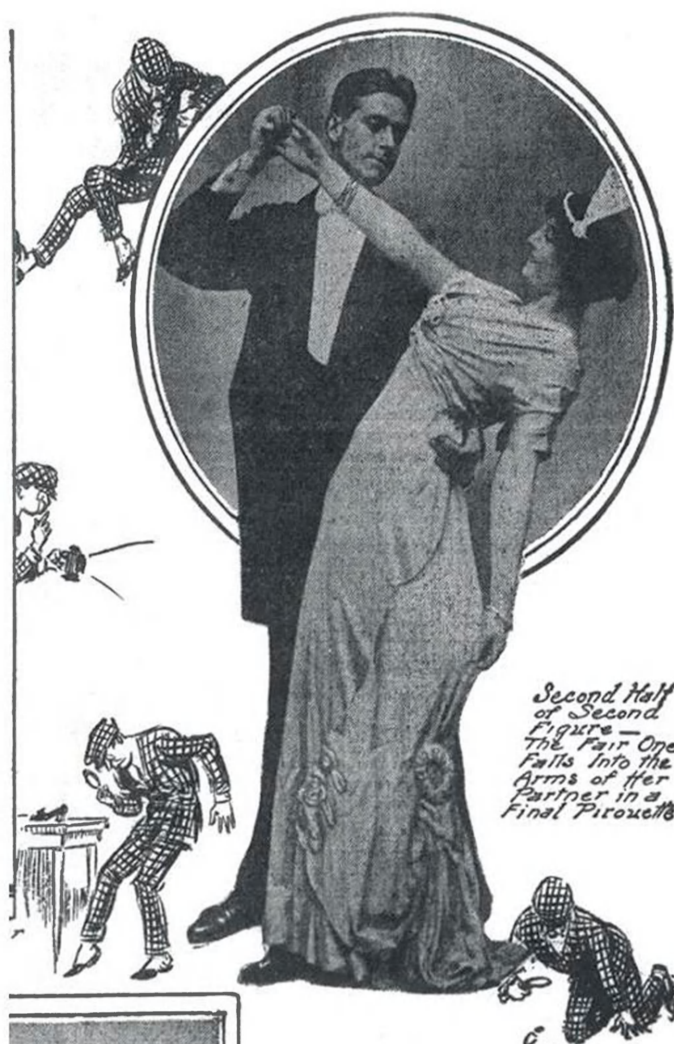
Second Half of Second Figure.—The Fair One Falls Into the Arms of Her Partner in a Final Flourish