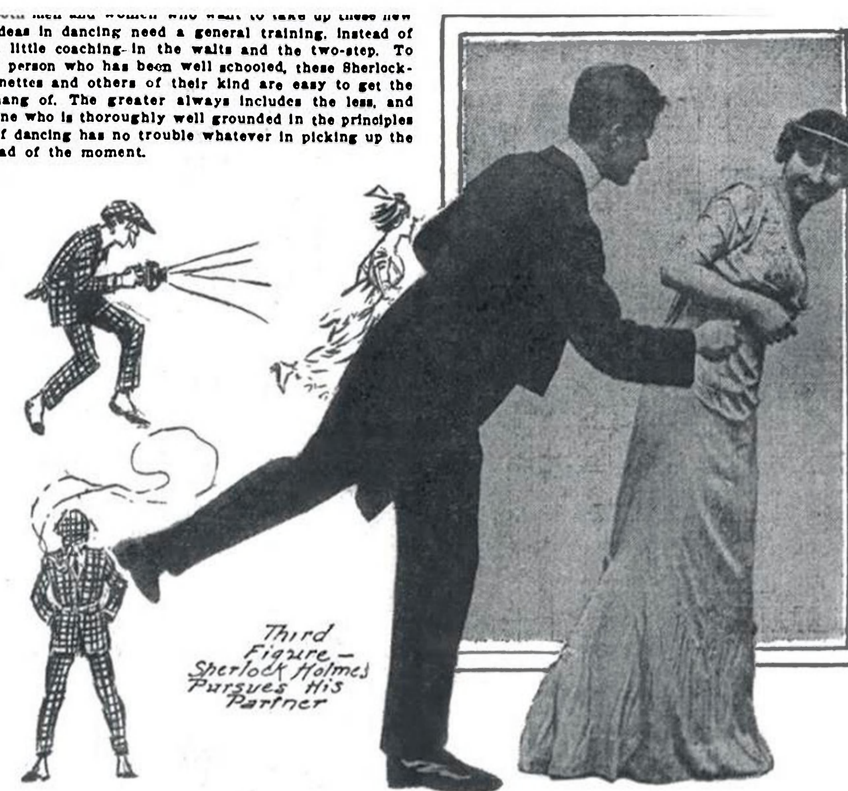
Third Figure.—Sherlock Holmes Pursues His Partner

These new ideas in dancing need a general training instead of a little coaching in the waltz and the two-step. To a person who has been well schooled, these Sherlockinettes and others of their kind are easy to get the hang of. The greater always includes the less, and one who is thoroughly well grounded in the principles of dancing has no trouble whatever in picking up the fad of the moment.