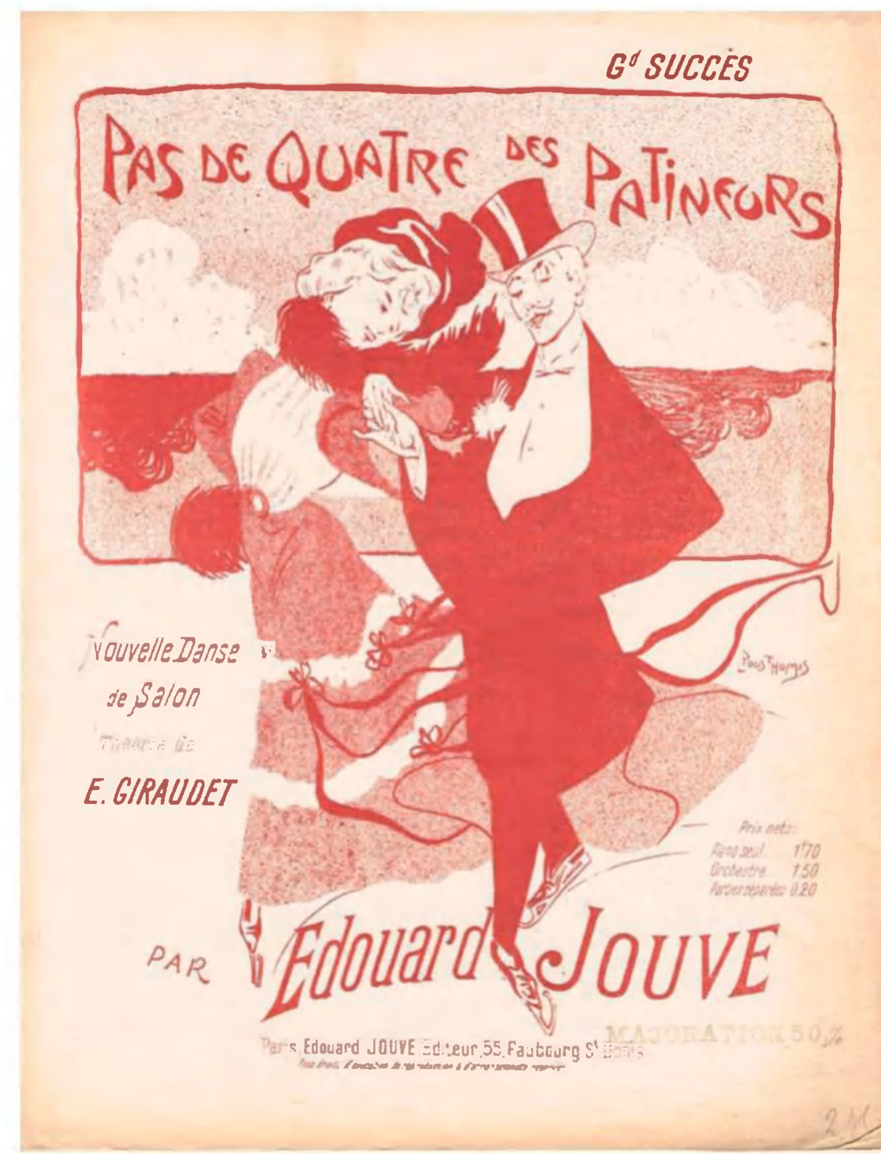
Forside af "Pas de Quatre des Patineurs" ca. 1910

To af Giraudets danse, som både er trykt i hans bøger og udgivet som node med dansebeskrivelse, er "Pas de Quatre des Patineurs", som er en mellemting mellem baldansen "Pas de Quatre" og "Skøjteløberdansen" samt pardansen "Pas des Aviateurs" – "Flyverdansen". Nogle danse fik navn efter en interessant begiven-