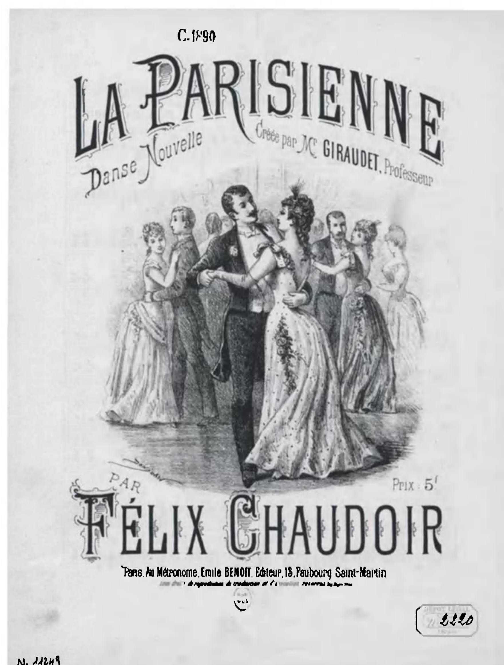
Forside af noden til "La Parisienne" 1890