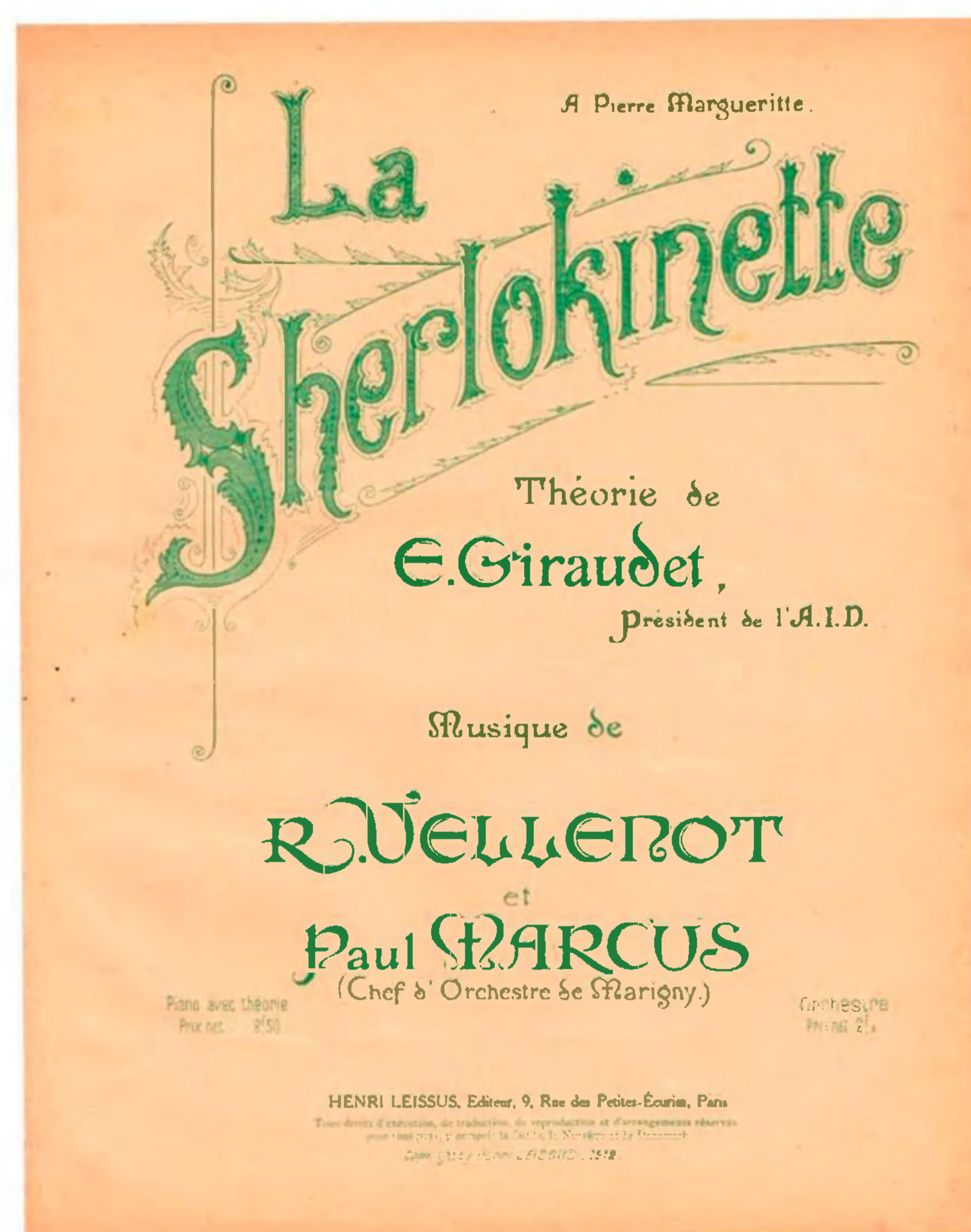
Forside af noden til "La Sherlockinette" (trykfejl, der mangler et c).