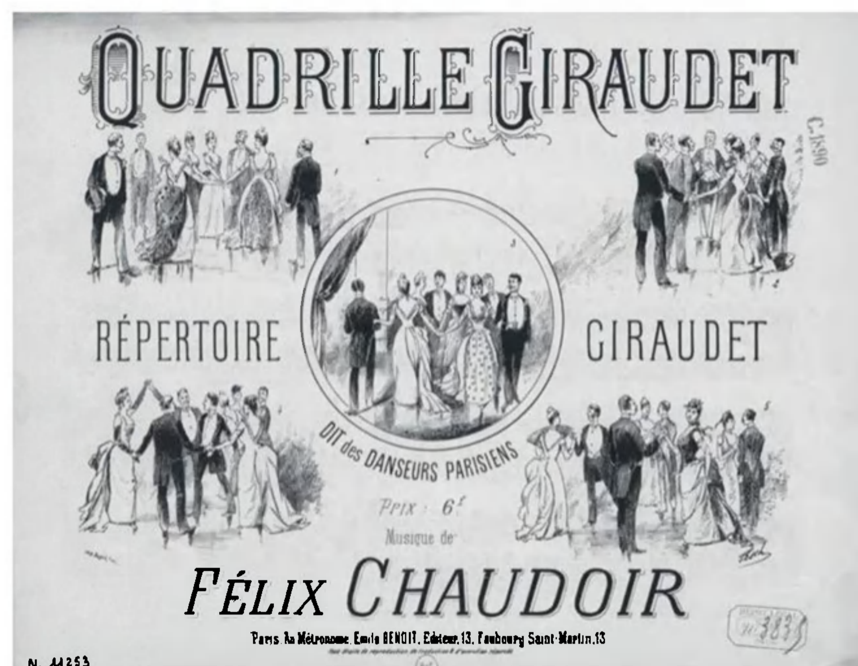
Forside af noden til Quadrille Giraudet 1890

ske komponist og koreograf Léopold Hyacinthe Gangloff (d. 1898).