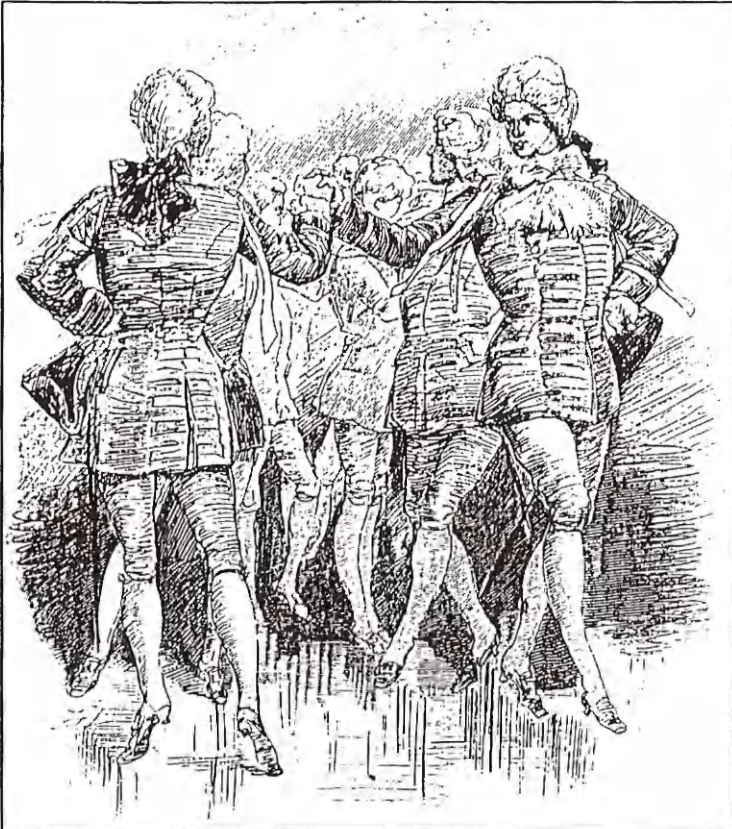
Kadetterne danser Menuet

"Rundt på gulvet" spillede udgaven fra Falster, hvor vi dansede menuet i opstilling som til "francaise". Desuden prøvede vi engelskdansen "Langsomme Gertrud", som den er noteret i folkedansernes Bornholms-hæfte, hvor menuet indgår som en del af hele dansen.