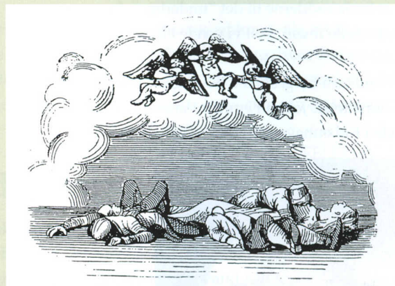
Gl. træsnit fra 1848 af slutscenen i "Kjærlighed uden Strømper"

Til sidst siger Jesper, at når de andre er døde, vil han heller ikke leve, så han slutter med at stikke sig i brystet, idet han siger: "Gid Eders Kierlighed må aldrig mangle Strømper".