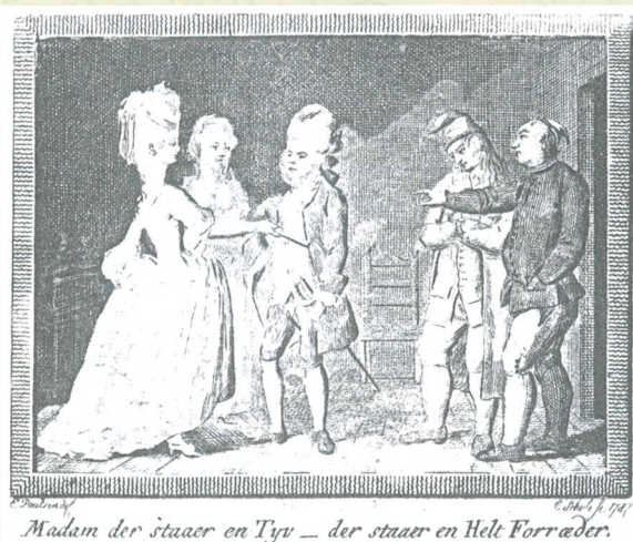
Gl. kobberstik fra 1787 af "Kierlighed uden Strømper"

ge helte og heltinder, der p.g.a. ulykkelige hændelser fik grumme skæbner, der ofte udmøntede sig i, at heltene og heltinderne begik selvmord for at have æren i behold.