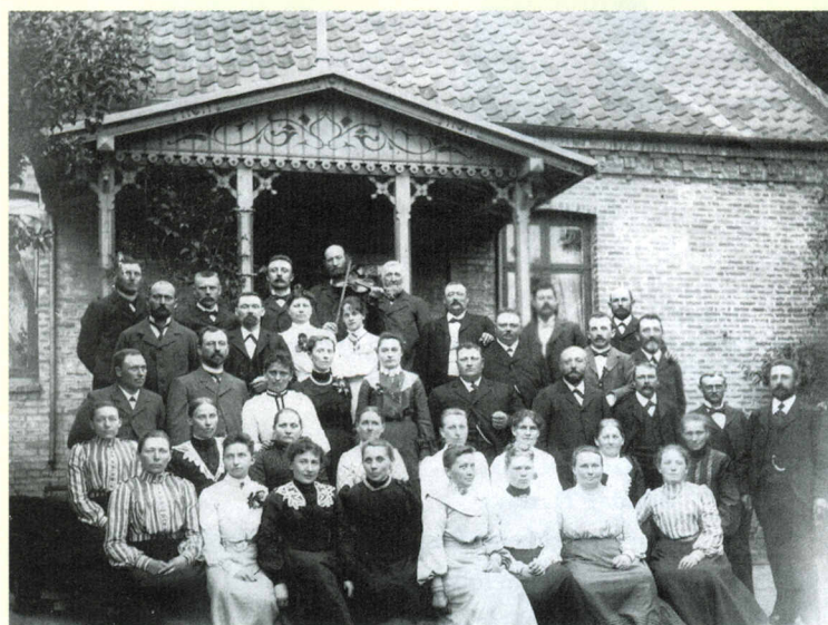
Folkedanseklubben "Capriolen" o. 1890-1894.

I 1890 startede man folkedanseklubben "Capriolen" med 20 par fra Hasleengen, hvor man dyrkede de bornholmske "opstille danse". Her er de fotograferet foran verandaen på Baggård.