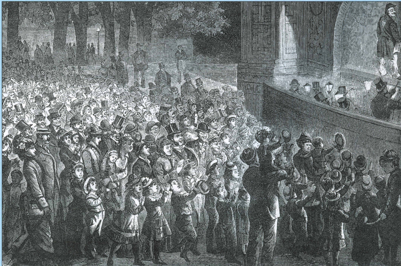
Børnefest på Pantomimeteatret i 1878.