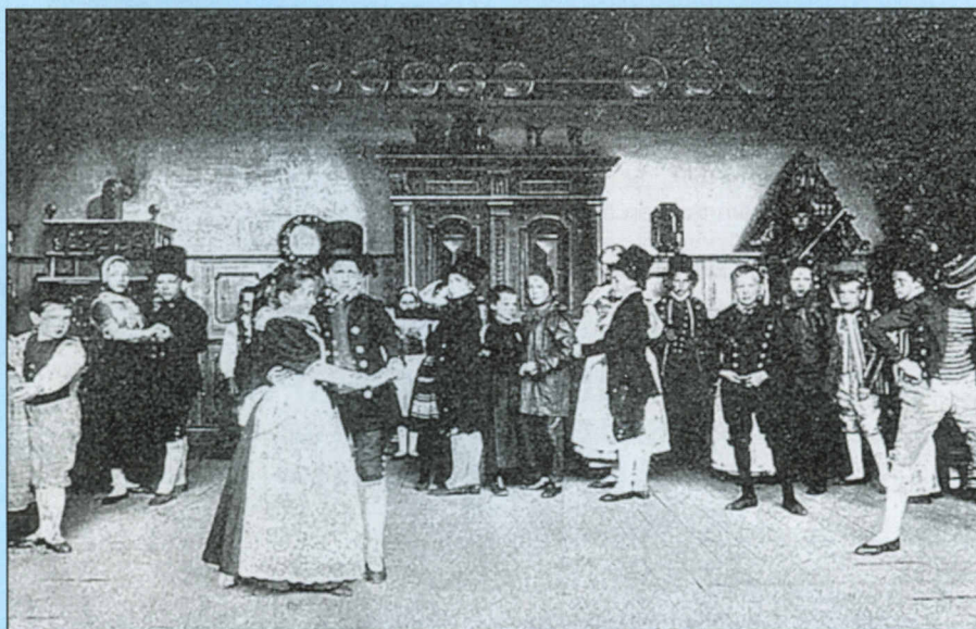
Børnene i "Bondebryllup" i Tivoli